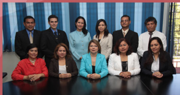
Equipo de Trabajo de la Defensoría Universitaria UES.

En el mes de marzo de 2012 la Defensoría UES juramentó a los Comités de Derechos Universitarios, en 2013 esa labor continuará.