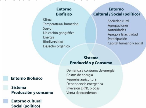
Figura 1. Espacio relacional multidimensional.