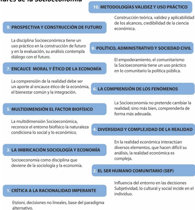
Figura 2 Pilares de la Socioeconomía