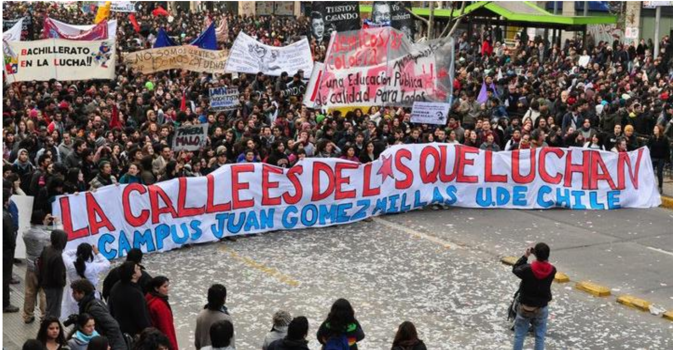
Alberto L. Bialakowsky 1* , Cecilia Lusnich 2** y Constanza Bossio 3***